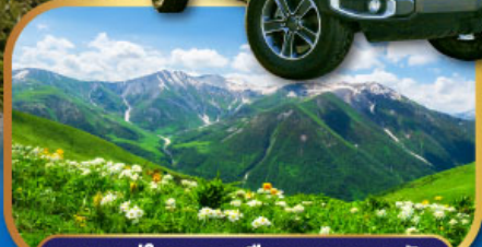
4WD สู๊ใจกลางเทือกเขาคอเคซัส