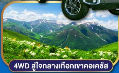
4WD สู่ใจกลางเทือกเขาคอเคซัส