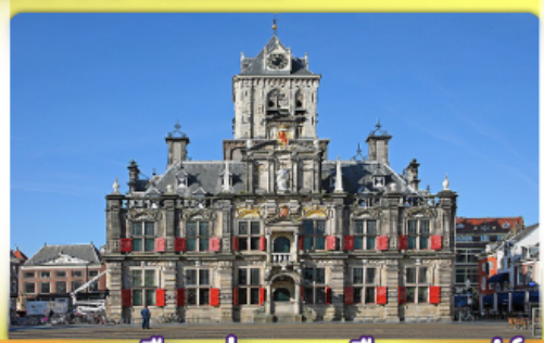
อาคารเมืองเก่าคลองเมืองเคลฟท์