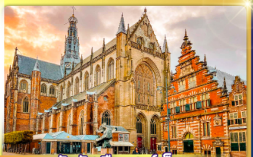
จัตุรัสเมืองฮาร์ลิม

พรมแดนเมืองเนเธอร์แลนด์และเบลเยียม เติมน้องเคลฟท์ เมืองเครื่องปั้นดินเผาระดับโลก ฮาร์ลิมเมืองมั่งคั่งที่สุดของเนเธอร์แลนด์