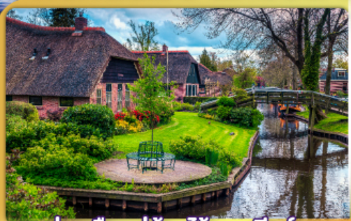
ล่องเรือหมู่บ้านไรทอนท์รูธ