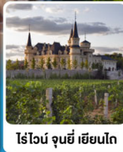
ไร่ไวน์ จุนยี่ เยียนโก