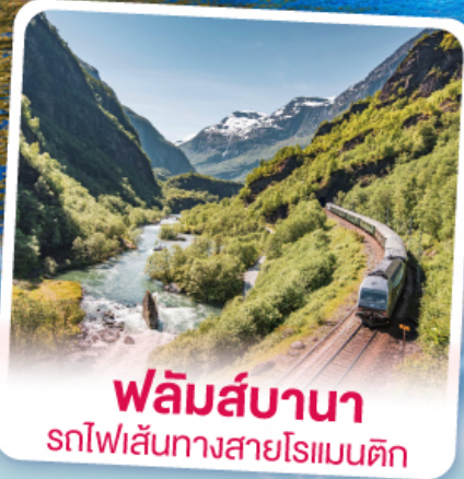
ฟลัมส์บานา รถไฟเส้นทางสายโรแมนติก