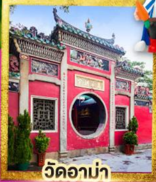
วัดอาบ่า