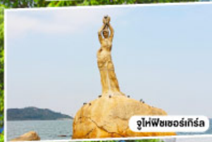
จูไห่พีซเซอร์เกิร์ล