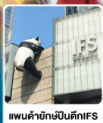
แพนด้ายักษ์ป็นตึกIFS