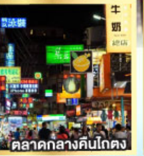
ตลาดกลางคืนโตง