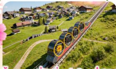
ชั้นรางที่ชันที่สุดในโลกสู่สตูล

พิชิตยอดเขาชุนเนกกา 1 ในเขาที่สวยงามที่สุดเมืองซอร์แมก