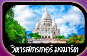
วิหารสกรเกอร์ มงมาร์ต