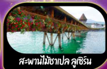
สะพานไม้ชาเปล คูซีน