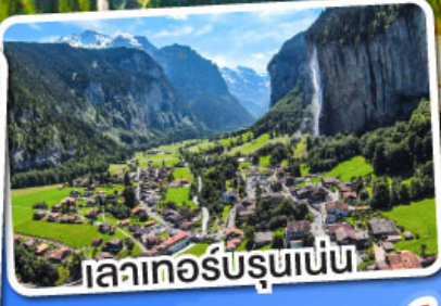
เลาเกอร์บรุนเนน

เดินทาง 12-18 มี.ค. 68 28 มี.ค.-03 เม.ย. 68 10-16 เม.ย. 68 29 เม.ย.-05 พ.ค. 68