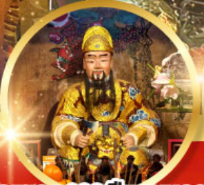
วัดแซกง 600 ปี หุ่นทอง