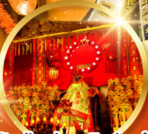
วัดเจ้าแม่กวนอิมฮ้องอำ (สวนหนานหลิน)