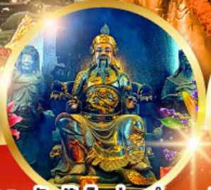
วัดปักโตฮ้องอำ