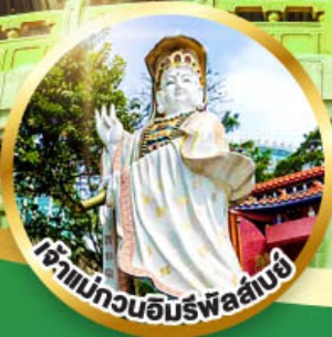
เจ้าแม่กวนอิมพรหลั่งน้ำทิพย์