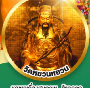
วัดหยวนทวยวน

ขอพรเรื่องสุขภาพ, โชคลาภ ความเจริญก้าวหน้า