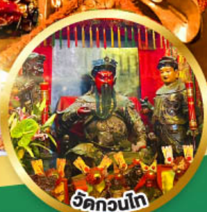
วัดกวนโก