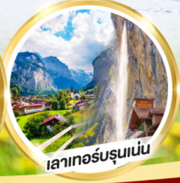
เลาเทอร์บรุนเนน