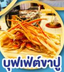
บุฟเฟ่ต์จางู