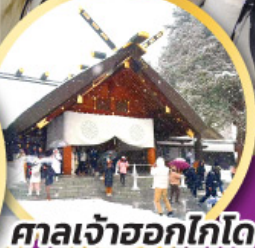
ศาลเจ้าฮอกไกโด

ชมความน่ารักของน้องๆ ที่สวนสัตว์อาซาฮิยาม่า