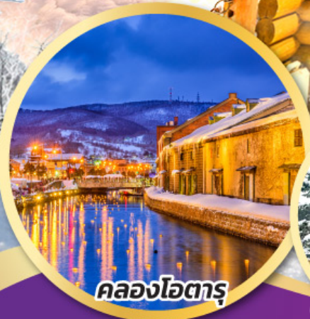
คลองโอตารุ