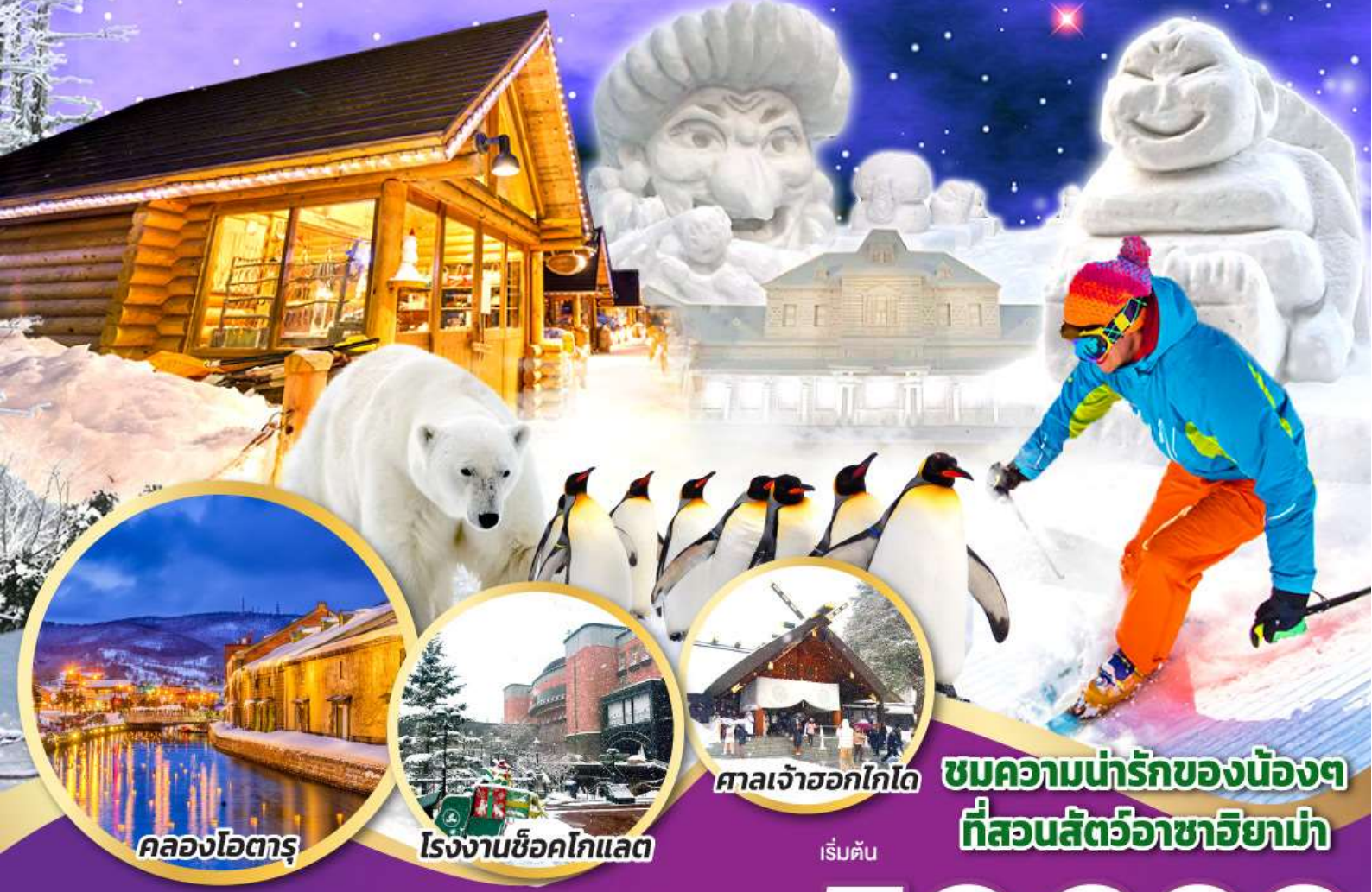
คลองโอตารุ