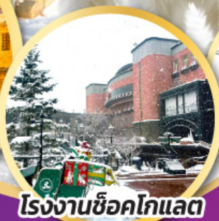
โรงงานช็อคโกแลต