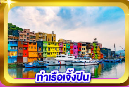
ท่าเรือเจิ้งปิง