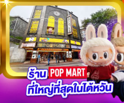
ร้าน POP MART ที่ใหญ่ที่สุดในไต้หวัน