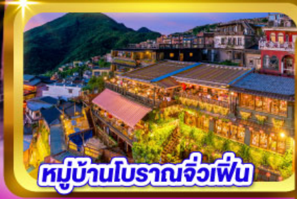
หมู่บ้านโบราณจิวเฟิน