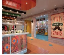
EL LOCO FRESH