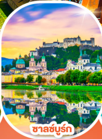
ซาลซ์บูร์ก