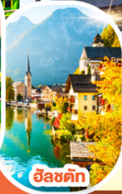
อินส์บรอก