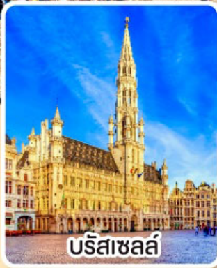
บรีซาเซล