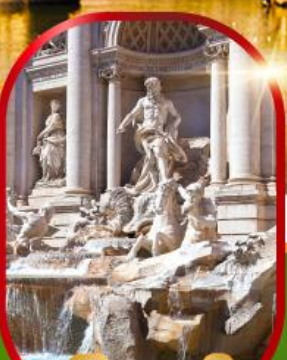
น้ำพุเทรวี่