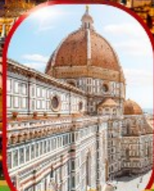
มหาวิหารฟลอเรนซ์