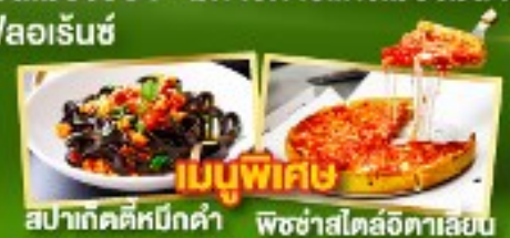
เมนูพิเศษ สปาคัดดีหมักดำ พิชซ่าสโตล์อิตาลีเลย