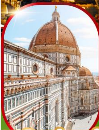
มหาวิหารฟลอเรนซ์