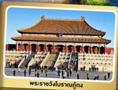
พระราชวังโบราณกู้กง