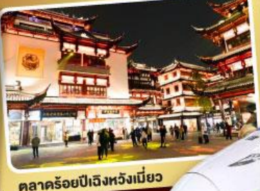
ตลาดร้อยปีเจิ้งหวิงเมี่ยว