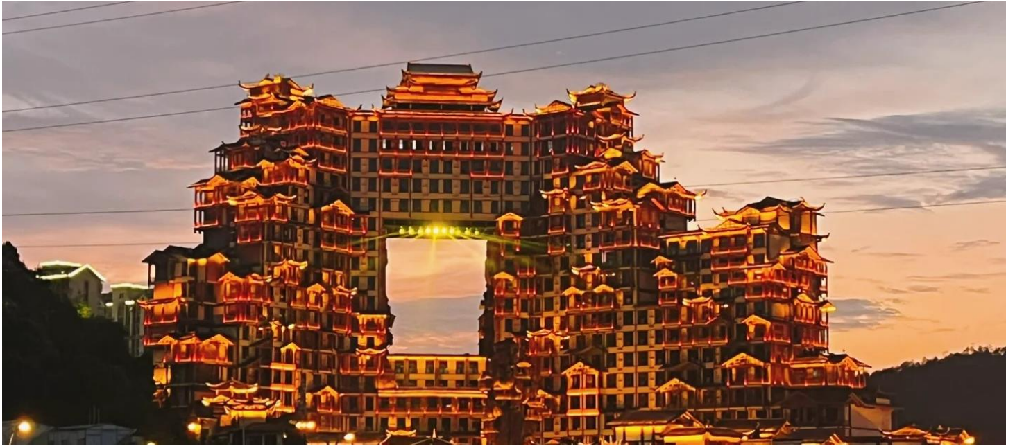
ที่พัก COUNTRY GARDEN PHOENIX HOTEL หรือเทียบเท่าระดับ 5 ดาว (มาตรฐานประเทศจีน)

ของจางเจี๋ยเจี๋ย จุดท่องเที่ยวแห่งใหม่ของจางเจี๋ยเจี๋ย แหล่งรวมร้านอาหาร ผับบาร์ ร้านขายของที่ระลึก รีสอร์ทและโฮมสเตย์ ที่แบ่งออกเป็นหลายๆ ส่วนอันรวมเอาเอกลักษณ์ของจีนมาไว้ที่นี้ทั้งสิ้น ไม่ว่าจะเป็นถนนสีสันเลียนแบบยุคเจ้าพ่อเซี่ยงไฮ้ ย่านโรงเตี๊ยมโบราณ งานแสดงโคมไฟสีสันอันเป็นเอกลักษณ์ นอกจากนี้ยังมีการแสดงจากเหล่านักร้องนักแสดงอยู่อีกมากมาย