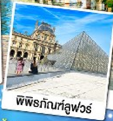
พีระกัมที่ลูฟวร์