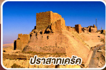
ปราสาทเคิร์ค