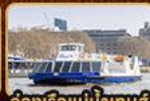
สองเรือแม่น้ำเทมส์