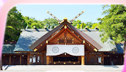
คาเฟ่ฮอกไกโด

เอาใจชาว Flower Lover ฟาร์มดอกทิวลิปโทมิตะฟาร์ม จุดยอดฮิตห้ามพลาด คลองสายวัฒนธรรมโอตารุ เครื่องแก้วโอตารุ พิพิธภัณฑ์กล่องดนตรี เป็นพระพุทธรเจ้า ขอปรรคาเจ้าฮอกไกโด มหัศจรรย์บ่อน้ำสีฟ้า ทะลุโรงงานช็อกโกแลตชิโรอิชิโตะชื่อดัง