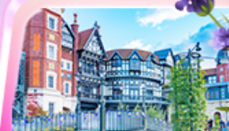
โรงแรมฮอกไกโด