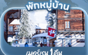
พักหมู่บ้าน เมอร์เรน 1 คืน

" เปิดประสบการณ์ก่อนใคร ขึ้นกระเช้าที่ชันที่สุดในโลกล่าสุด!! Schilthornbahn 20XX " และขึ้นกระเช้า Eiger Express พิชิตยอดเขาจุงเฟรา TOP OF EUROPE เยือนหมู่บ้านเซอร์แมท ชมวิวยอดเขาเมทเทอร์ฮอร์น น้ำพุจรวดเจ็ทโต ศาลาไทย ชาลี แซปลิน The Fork ทะเลสาบสีฟ้าเบลลาเซ น้ำตกกลางหมู่บ้านเลาคอร์บรุนเนิน เมืองลูเซิร์น สิงโตหินแกะสลัก สะพานไม้ชาเปล และเมืองชุกเมืองริมทะเลสาบ