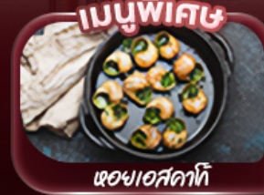
ผอชอเสคคาคี