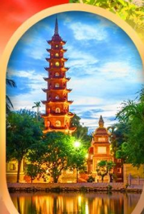
วัดเจินทิว๊ก