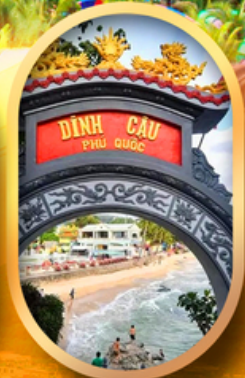
ศาลเจ้าดิงเกา