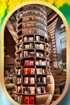
ร้านขายหนังสือ