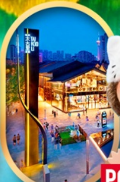
ถนนคนเดินไท่กู่หลี่