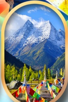
อุทยานสีดรุณี