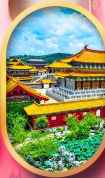
เมืองจำลองสามก๊ก