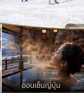
ออนเซ็นญี่ปุ่น