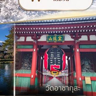
วัดวาคูสะ