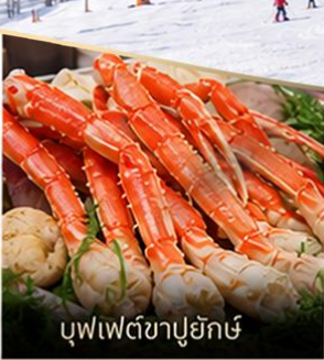
บุฟเฟ่ต์ซาปูยักซ์