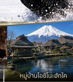
หมู่บ้านโอชิโนะอักษโค