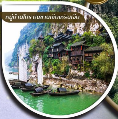
หมู่บ้านโบราณชานเซี่ยเหรินเจีย