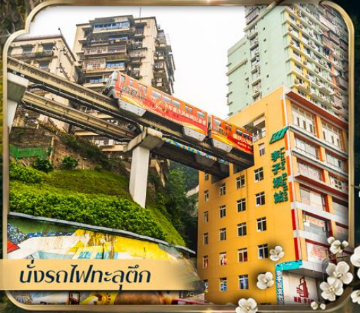
นั่งรถไฟทะลุติ๊ก

คอนเฟิร์มออกเดินทาง ตั้งแต่ 10 ท่าบ ขึ้นไป