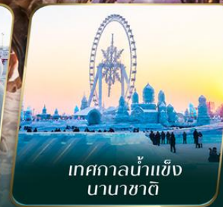
เทศกาลน้ำแข็ง นานาชาติ