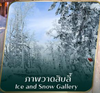
ภาพวาดสิบลี้ Ice and Snow Gallery

ตั๋วเครื่องบินออกเดินทาง ตั้งแต่ 15 วัน ขึ้นไป