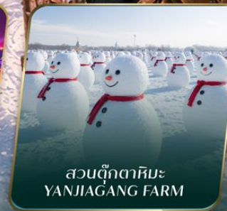
สวนตุ๊กตาหิมะ YANJIAGANG FARM