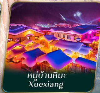
หมู่บ้านหิมะ Xuexiang