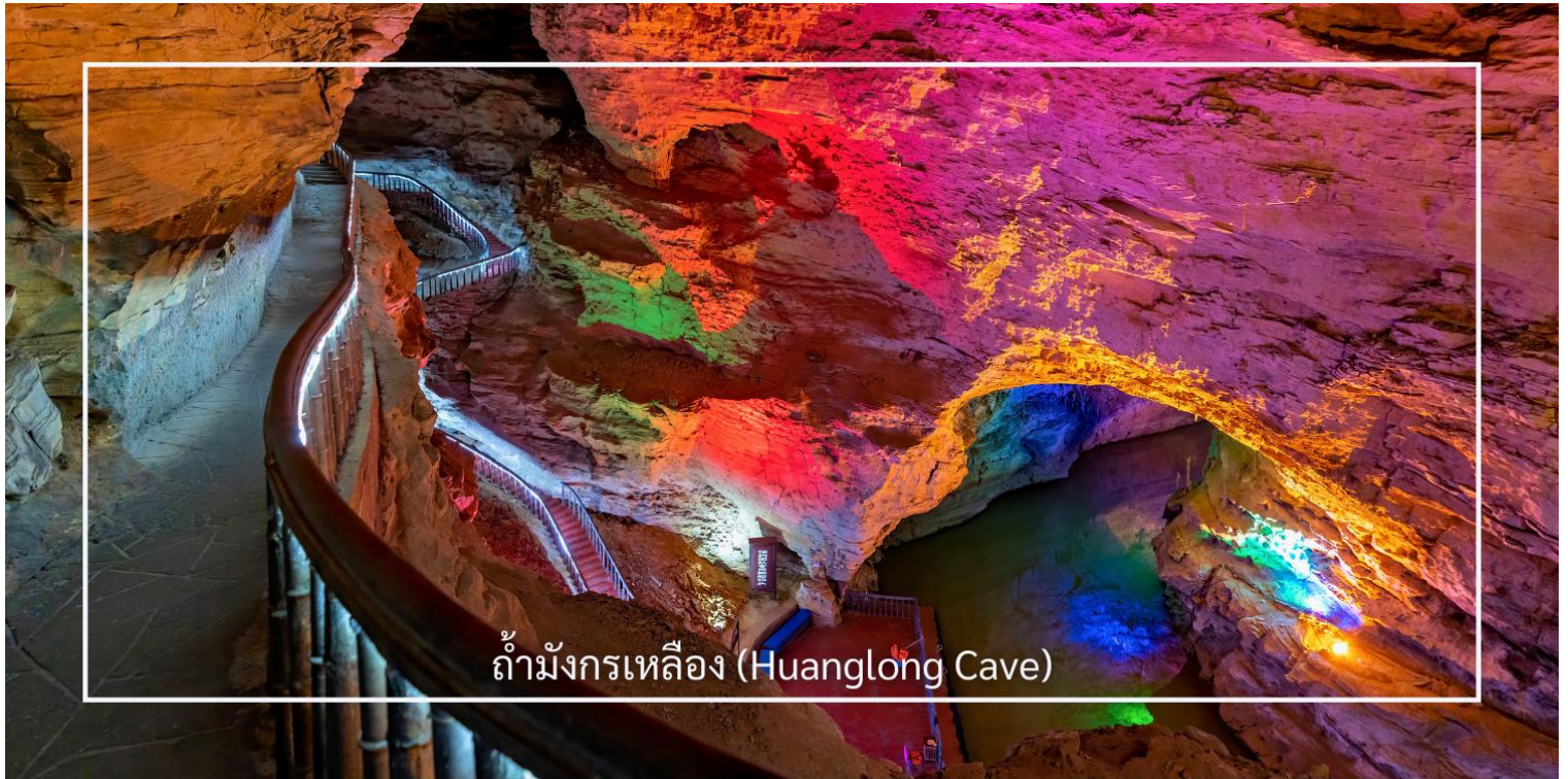
ถ้ำมังกรเหลือง (Huanglong Cave)

เย็น บริการอาหารเย็น ณ ภัตตาคาร (มื้อที่ 9) จากนั้นเดินทางเข้าสู่โรงแรมที่พัก HONG QIAO HOTEL ระดับ 4 ดาว หรือเทียบเท่า