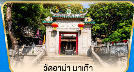
วัดอาม่า มาเก๊า