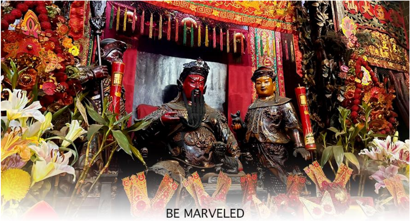
BE MARVELED วัดกวนอู

คงไม่ให้เพลิงพลาแกศัตรู ทำให้มีมิตรที่ซื่อสัตย์ และคุ้มครองบริวารให้ก้าวหน้าและอยู่เย็นเป็นสุข ซึ่งผู้ประกอบอาชีพ ตำรวจ ทหาร และ นักการเมือง จึงมักจะนิยมบูชาเทพเจ้ากวนอู เป็นพิเศษ