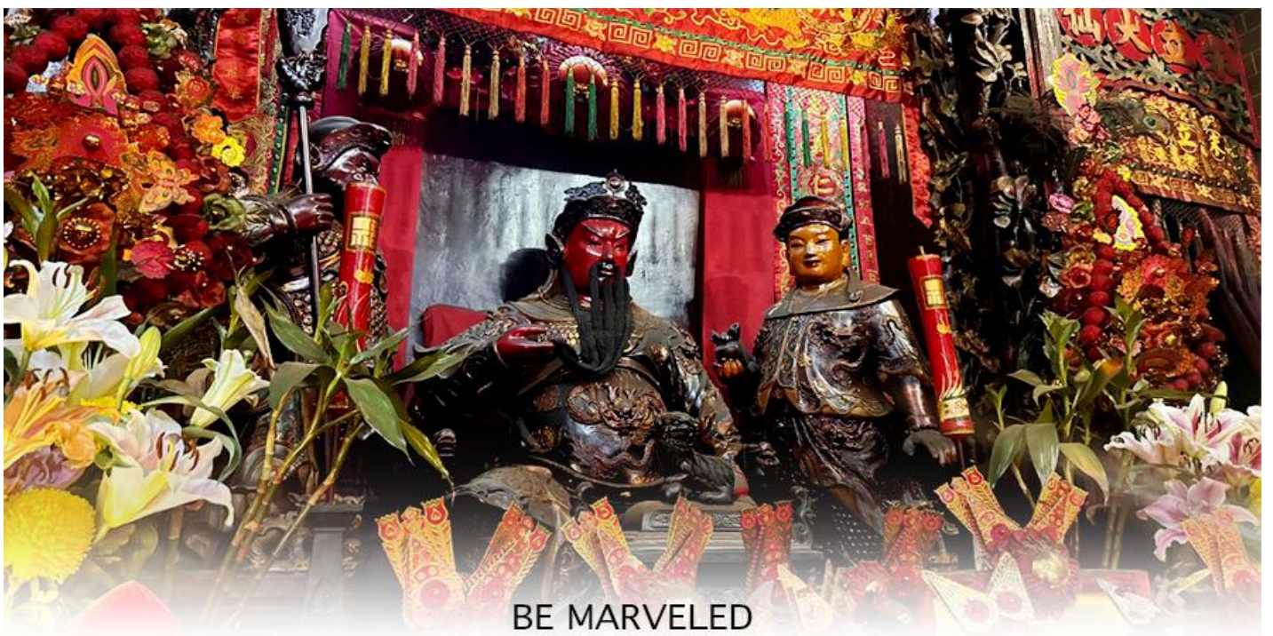
BE MARVELED วัดกวนอู

ท่านเดินทางสู่ วัดกวนไท หรือที่คนไทยนิยมเรียกว่า " วัดเทพเจ้ากวนอู " เป็นสถานศักดิ์สิทธิ์อันเลื่องชื่อ ถือว่าเป็นวัดแห่งเดียวในเขตเกาลูน ที่สร้างขึ้นเพื่อบูชา เทพเจ้ากวนอู ซึ่งท่านเป็นเทพเจ้าแห่งความซื่อสัตย์ เปี่ยมไปด้วยคุณธรรม โดยศาลเจ้าพ่อกวนอูแห่งนี้ ผู้ที่มาไหว้สักการะจะนิยมขอพรเรื่องธุรกิจและบิรวาร เนื่องจากว่าเจ้าพ่อกวนอู เป็นเทพเจ้าที่รักษาคำพูดด้วยชีวิต รักคุณธรรม ซื่อสัตย์ ช่วยปกป้องสิ่งเลวร้าย อันตรายต่าง ๆ และช่วยเสริมอำนาจบารมีในการปกครอง ท่านมีจิตใจมั่นคงตั้งขุนเขา มีสติปัญญาเป็นเลิศ และไม่ประมาท ท่านจึงเป็นสัญลักษณ์แห่งความเข้มแข็งโดดเด่นเดี่ยว ไม่ครั้นคร้ามต่อศัตรู ฉะนั้นการมาบูชาขอพรท่าน จะช่วยเสริมดวงไม่ให้เพลี่ยงพล้ำแก่ศัตรู ทำให้มีมิตรที่ซื่อสัตย์ และคุ้มครองบิรवारให้ก้าวหน้าและอยู่เย็นเป็นสุข ซึ่งผู้ประกอบอาชีพ ตำรวจ ทหาร และ นักการเมือง จึงมักจะนิยมบูชาเทพเจ้ากวนอู เป็นพิเศษ