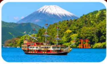
ล่องเรือทะเลสาบอาชิ