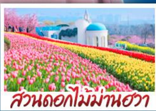
สวนดอกไม้บ้านฮวา