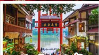
หมู่บ้านโบราณฉือซีโจว