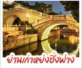
ย่านเก่าเซียงซิงฟาง