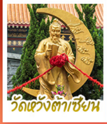
วัดเว้งต้าเซียน