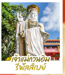
เจ้าแม่กวนอิม รพีลส์เบย์