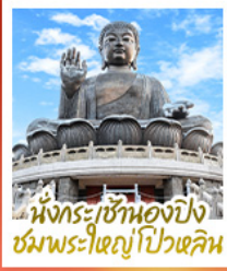
นั่งกระเช้ามองปิง ชมพระใหญ่ไผ่หลิน

นั่งกระเช้ามองปิงสักการะพระใหญ่ไผ่หลิน • วัดหวังต้าเซียน ขอพรสุขภาพ ความรัก วัดเขangkงเมี้ยว ขอพรองค์เซกุง โชคลาภ การเงินและธุรกิจ • เจ้าแม่กวนอิมรพีลส์เบย์ รับพลังงานดี เสริมพลังสงจุย • วัดหมิ่นโหมว ขอพรเรื่องการศีกษา การงาน สติปัญญาและความกล้าหาญ