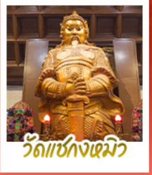
วัดเขangkงเมี้ยว