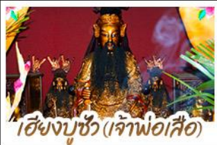
เซียงจูซิว (เจ้าพ่อเสือ)