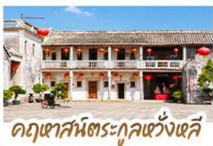
อุทยานวัฒนธรรมกุหลาบหงษ์

ตามรอยภาพยนตร์สุดซึ้งแห่งปี "จดหมายรักถึงอาม่า" • เยี่ยมเมืองโบราณแตงจิว ดินแดนต้นกำเนิดชาวจีนโพ้นทะเลที่อพยพสู่ประเทศไทย • เดินเล่นหมู่บ้านโบราณหลงหู สัมผัสบรรยากาศเดจิวดั้งเดิมราวกับหลุดเข้าไปในฉากหนัง • ชมย่านเมืองเก่าซิวเถาและ สวนสาธารณะเสี่ยววงหยวน หนึ่งในสถานที่ถ่ายทำที่ได้รับความนิยมจากแฟนภาพยนตร์ ชมจดหมายโบราณอายุกว่าร้อยปี ณ พิพิธภัณฑ์จดหมายชาวจีนโพ้นทะเล