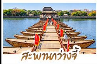
สะพานกว้างจี