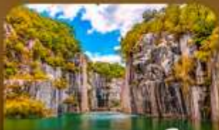
เขตเขาตึกละเมืองโพซอน

ตามหาใบไม้เปลี่ยนสีสุดโรแมนติก ชมวิวแบบพาโนรามาจากสะพานแขวนรูปตัว Y แห่งเมืองโพซอน สัมผัสความงดงามของโพซอนฮาร์วีย์เลย์ • เดินเล่นท่ามกลางคิมแจเป็ทวียและทะเลปิลในพร-ราชวังเคียงบกกุง ชมหมู่บ้านฉิมอกกลางบรรยากาศอันชุก และปิดท้ายด้วยหมู่ทิวทัศน์อง ณ สวนอานีส และศูนย์ถ่ายทอดนิยมของกรุงโซล ในช่วงฤดูใบไม้เปลี่ยนสีที่สวยงามที่สุด