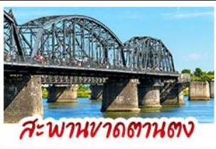
สะพานหวาดถานตง

2 มหัศจรรย์ธรรมชาติระดับโลก "หาดแดงผานจิน" คู่กับ "ถ้ำน้ำเป็นสี" ยืนมองฝั่งเกาหลีเหนือที่ตามอง • ชมความยิ่งใหญ่ของพระราชวังเส้นหยางกู่กิง