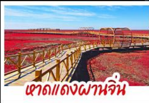
หาดแดงผานจิน