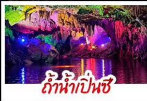
ถ้ำน้ำเป็นสี