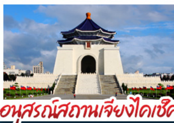
อุทยานสถานเจียงไคเช็ค